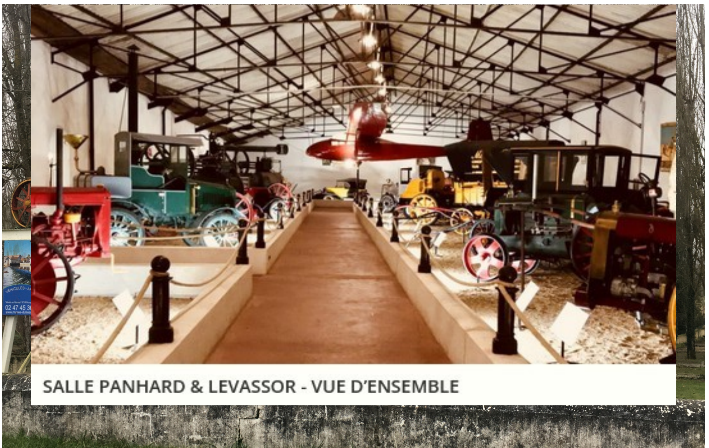
SALLE PANHARD & LEVASSOR - VUE D'ENSEMBLE